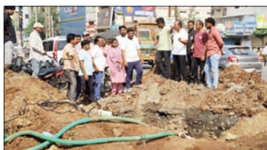
పరిష్కారంలో నిరక్షమై ప్రదర్శించవద్దని హెచ్చరించారు. ఎండాకాలంలో ప్రజలు తాగునీటి ఇబ్బందులు ఎదుర్కోకుండా యుద్ధ ప్రాతిపదికన మరమ్మత్తు పనులు చేపట్టి ఈరోజు సాయంత్రం లోపల పూర్తి చేయాలని అధికారులను ఆదేశించారు. అదేవిధంగా, రేపటి ఉదయం నుంచే పాల్వంచ పట్టణ ప్రజలకు తాగునీటి సరఫరా పునరుద్ధరించేలా అవసరమైన చర్యలు తీసుకోవాలని నష్టమైన ఆదేశాలు జారీ చేసినట్లు మేయర్ తెలిపారు. ప్రజలకు ఇబ్బందులు కలగకుండా అధికారులు నిరంతరం పర్యవేక్షిస్తూ సమస్యను త్వరితగతిన పరిష్కరించాలని సూచించారు.

పాల్వంచ పట్టణంలోని అంబేద్కర్ సెంటర్ వద్ద డ్రింకింగ్ వాటర్ పైప్ లైన్ లోకి జపి కారణంగా గత రెండు రోజులుగా తాగునీటి సరఫరా నిలిచిపోవడంతో మేయర్ మూడ్ గణేష్ ఆదివారం ఘటన స్థలాన్ని సందర్శించి పరిస్థితిని పరిశీలించారు. లోకేష్ జరిగిన ప్రాంతానికి సంబంధిత అధికారులను వెంటనే పిలిపించి సమస్య