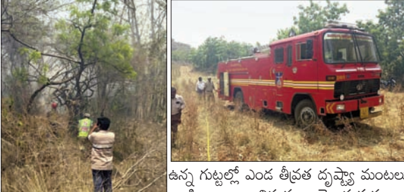
ఉన్న గుట్టల్లో ఎండ తీవ్రత దృష్ట్యా మంటలు వ్యాపించాయి. విషయం తెలుసుకున్న ఆ ప్రాంత రైతులు పోలీసులకు సమాచారం అందించడంతో కొత్తగూడెం మంచి ఫైర్ ఇంజన్ తో వచ్చిన సిబ్బంది గుట్టలపై మంటలను ఆర్పారు. ఈ ప్రాంతాల్లో జూలూరుపాడు, పాపాయిల్ తోటలు ఎక్కువగా ఉండటంతో రైతులు ఎండల తీవ్రత దృష్ట్యా ఎప్పుడు అగ్ని ప్రమాదం సంభవిస్తుందోనని ఆందోళన చెందుతున్నారు. వరుస ప్రమాదాలతో పోలీస్ శాఖ సైతం అప్రమత్తంగా ఉండటంతో పాటు, రైతులు, ప్రజలకు తగు సహాయం అందించేందుకు నిత్యం సిద్ధంగా ఉంటుంది.

గత పది రోజులుగా వాతావరణంలో ఉష్ణోగ్రత తీవ్రత రోజురోజుకు పెరుగుతూ వస్తుంది. మండే ఎండలతోపాటు వడగాలులు వీస్తుండడంతో అటవీ, రెవెన్యూ ప్రాంతాల్లోని గుట్టల్లో, అడవుల్లో మంట రాజుకుంటుంది. గుట్టల ప్రాంతాల్లో ఎక్కడ చూసినా చెట్లు, పొదలు కాలుతూనే దర్శనమిస్తున్నాయి. ఈ వేసవి సీజన్ ప్రారంభంలోనే వినోబానగర్ ప్రాంతంలో మధ్యాహ్నం సమయం పాపాయిల్ తోటలో చెలరేగిన మంటలు ఆ ప్రాంతమంతా వ్యాప్తి చెందాయి. మిరప, మొక్కజొన్న పంటలు ప్రమాదంలో దెబ్బతిన్నాయి. ఇదే తరహాలో జూలూరుపాడు పరిధిలో పరికోతల ముగింపు అనంతరం చేలలో ఉన్న గడ్డికి ప్రమాదపశాత్తు నిప్పంటుకొని ఆ ప్రాంతమంతా దట్టమైన పొగలతో వ్యాప్తి చెందింది. రెండు రోజుల క్రితం అర్ధరాత్రి సమయంలో సీతారామ ప్రాజెక్ట్ కార్యాలయం సమీపంలోని జూలూరుపాడు తోటకు నిప్పు అంటుకుంది. ఆ ప్రాంతంలో తెల్లారిండాకా పెద్ద ఎత్తున మంటలు వ్యాపించాయి. ఈనేపథ్యంలోనే ఆదివారం మధ్యాహ్నం జూలూరుపాడు నుంచి ఒంటెగుడిసి వెళ్లే మార్గంలో