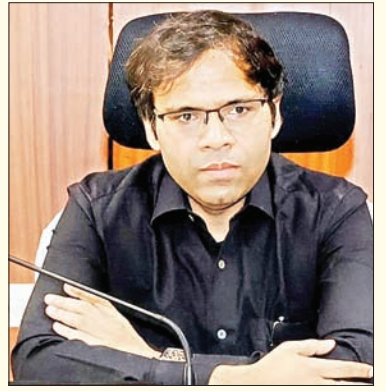
ప్రజావాణికి అధికారులు సకాలంలో హాజరు కావాలి