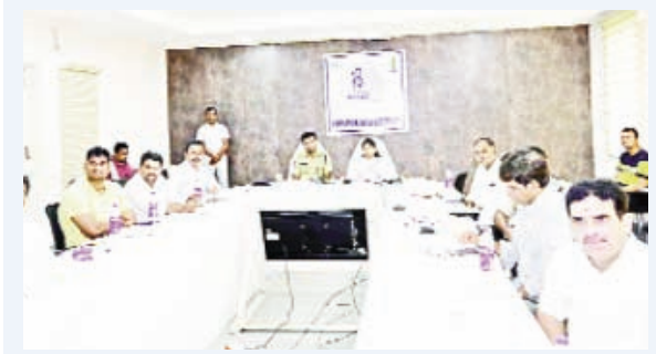
పంట అవశేషాలను కాల్చకుండా రైతులకు అవగాహన కల్పించాలి

-వీడియో కాన్ఫరెన్స్ లో ఉపముఖ్యమంత్రి మల్లు భట్టి విక్రమార్కు