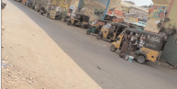
తీసుకోవాలని వైద్యులు సూచిస్తున్నారు.

బోనకల్, ప్రభాతవార్త: తెలంగాణలో ఎండలు రోజురోజుకూ తీవ్రరూపం దాల్చుతున్నాయి. భానుడి భగభగలకు ప్రజలు ఉ క్విరిక్విరి అవుతున్నారు. పగటి ఉష్ణోగ్రతలు భారీగా నమోదవుతుండటంతో మధ్యాహ్నం వేళ రహదారులు నిర్మానుష్యంగా మారి కర్నూను తలపిస్తున్నాయి. మండల వ్యాప్తంగా అధిక ఉక్కుపోతతో ప్రజలు తీవ్ర ఇబ్బందులు ఎదుర్కొంటుండగా, అవసరమైతే తప్ప బయటకు రావద్దని ప్రభుత్వం జిల్లా అధికారులు హెచ్చరిస్తున్నారు. వడదెబ్బ బారిన పడకుండా తగిన జాగ్రత్తలు